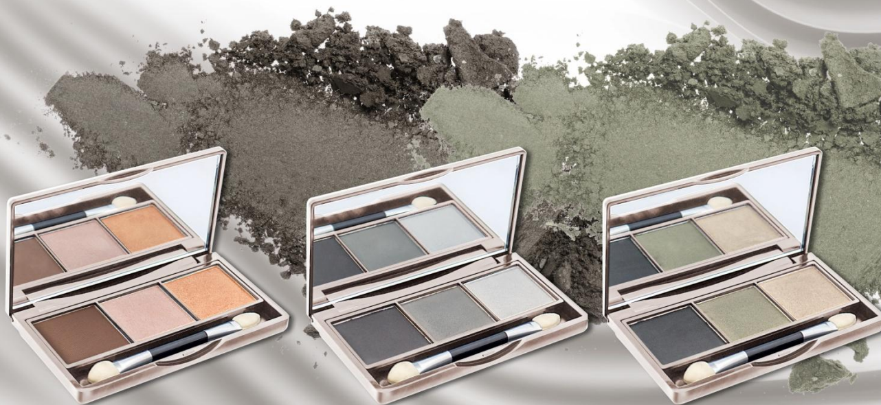
Odstín 01 – Romantic Cocktail