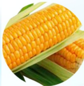
aminokyseliny kukuřičného glutenu